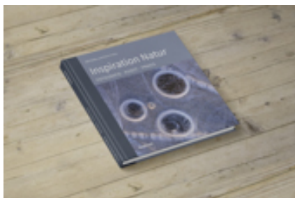
Inspiration Natur. Fotografie · Kunst · Praxis