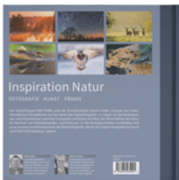
Inspiration Natur – Rückseite