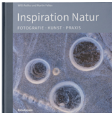
Inspiration Natur – Cover

Hochaufgelöstes Bildmaterial finden Sie in unserem Presse-Center: www.fotoforum.de/presse