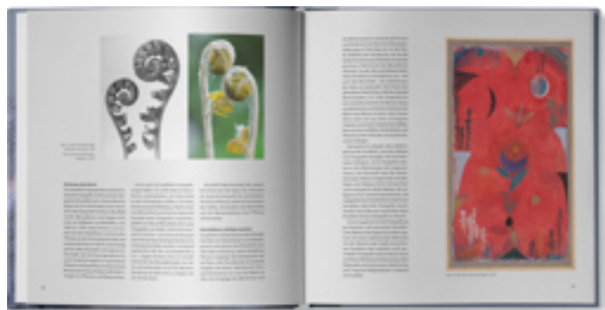
Aufsätze von Martin Feltes zum Spannungsfeld von Fotografie und Kunst