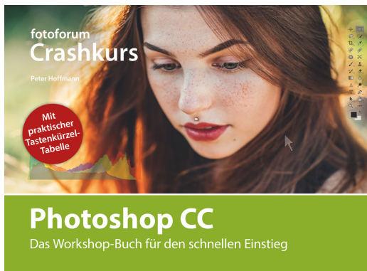
fotoforum Crashkurs: Photoshop CC // Cover

Hochaufgelöstes Bildmaterial finden Sie in unserem Presse-Center: www.fotoforum.de/presse